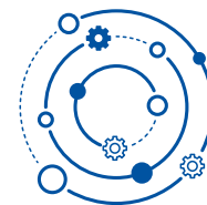
合作伙伴关系的重要性

我们承认每位员工的独特性 和带给公司的价值。 我们认可个人和团队对战胜挑战 和实现目标所付出的努力，并 一同分享我们的成功。