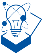
创新精神和企业家精神

我们诚信于我们所有的员工 和与企业相关的人员。 我们信守我们的诺言。 我们尊重他人。 我们努力建立信任关系。