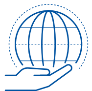
授权、责任和倾听的义务

我们充分授权并要求承担责任。决策权 最终的归属取决于由谁来承担责任并 对结果负责。我们要求决策和行动与 我们的整体方针和价值观是一致的。